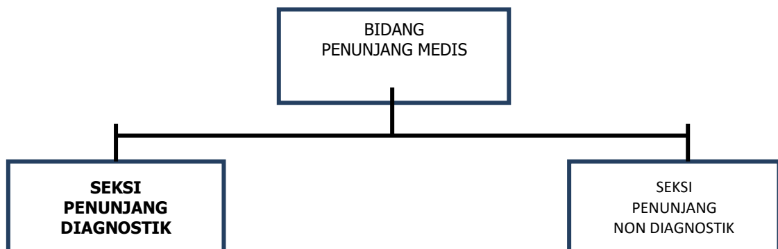
Gambar 1.1 Struktur Organisasi Seksi Penunjang Diagnostik Rumah Sakit Jiwa Daerah Surakarta Provinsi Jawa Tengah