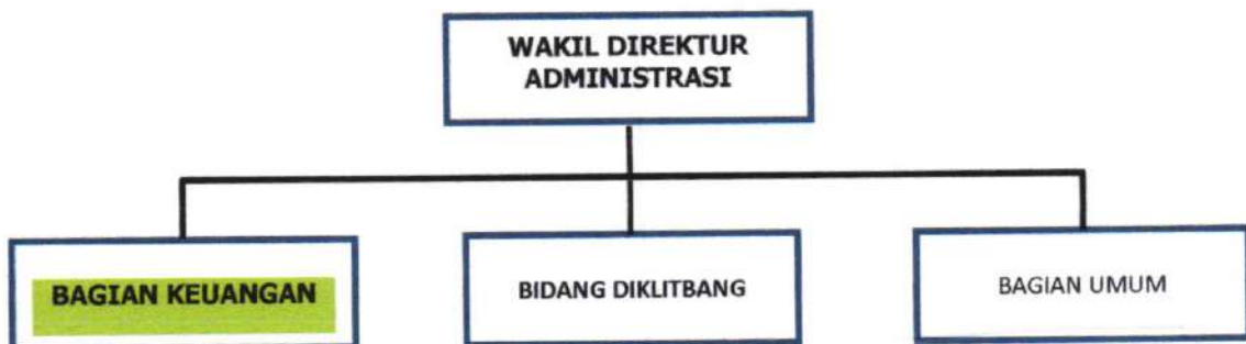
Gambar 1.1 Struktur Organisasi Bagian Keuangan RSJD Surakarta

Sumber : Peraturan Daerah Provinsi Jawa Tengah Nomor 8 Tahun 2008