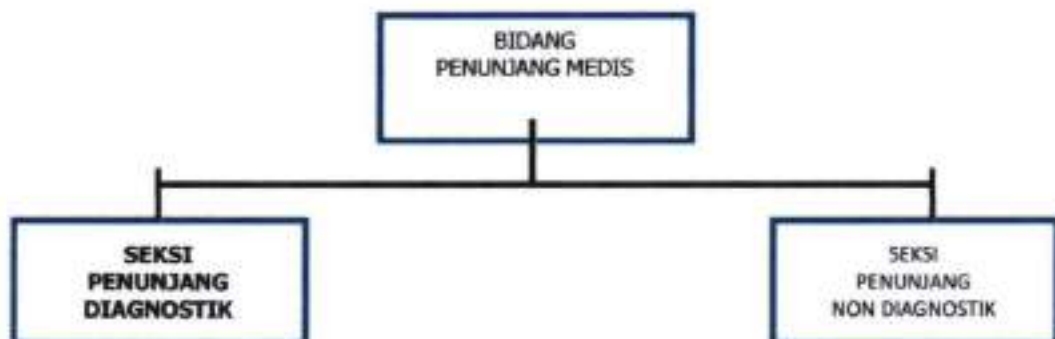
Gambar 1.1 Struktur Organisasi Seksi Penunjang Diagnostik Rumah Sakit Jiwa Daerah Surakarta Provinsi Jawa Tengah