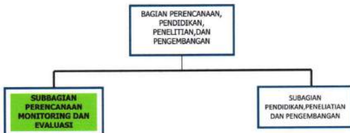
Gambar 1.1 Struktur Organisasi Sub Bagian perencanaan Monitoring & Evaluasi RSJD Surakarta